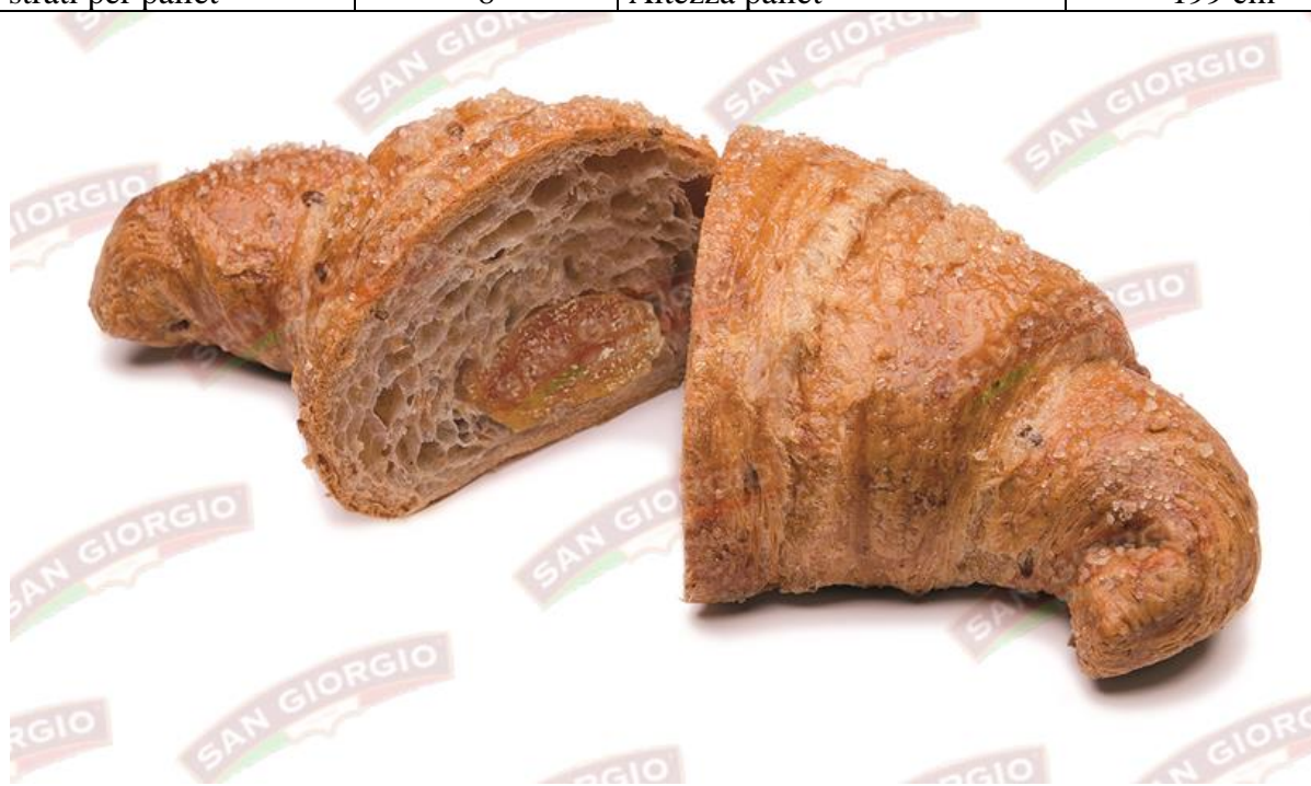
La foto è solo a scopo puramente illustrativo